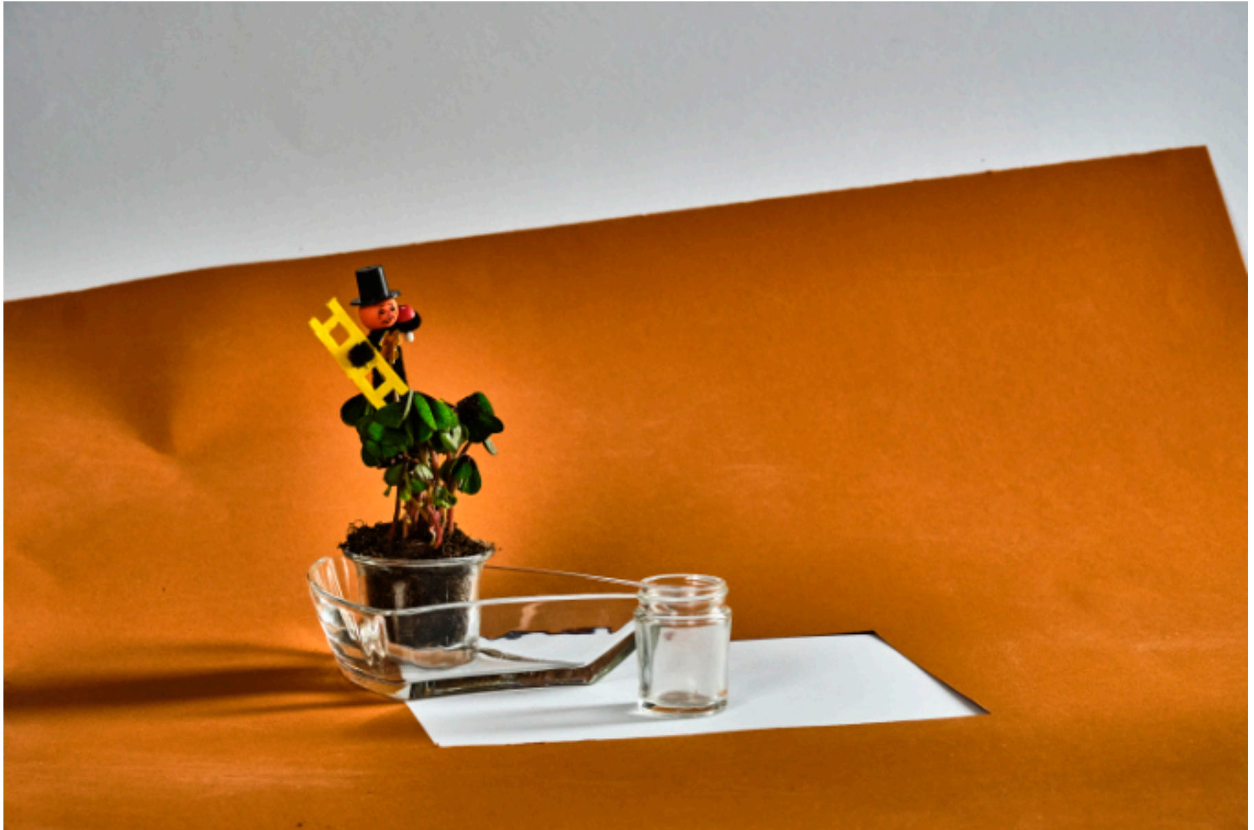
Formen, Farben, Licht