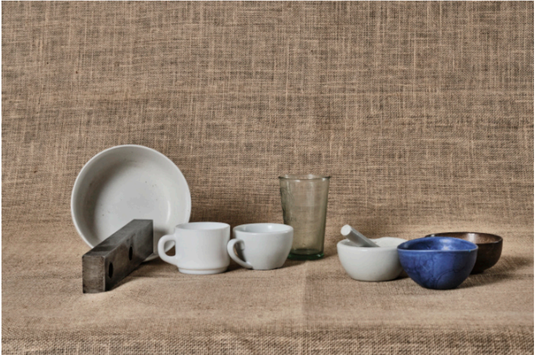
Erneute Annäherung an Morandi