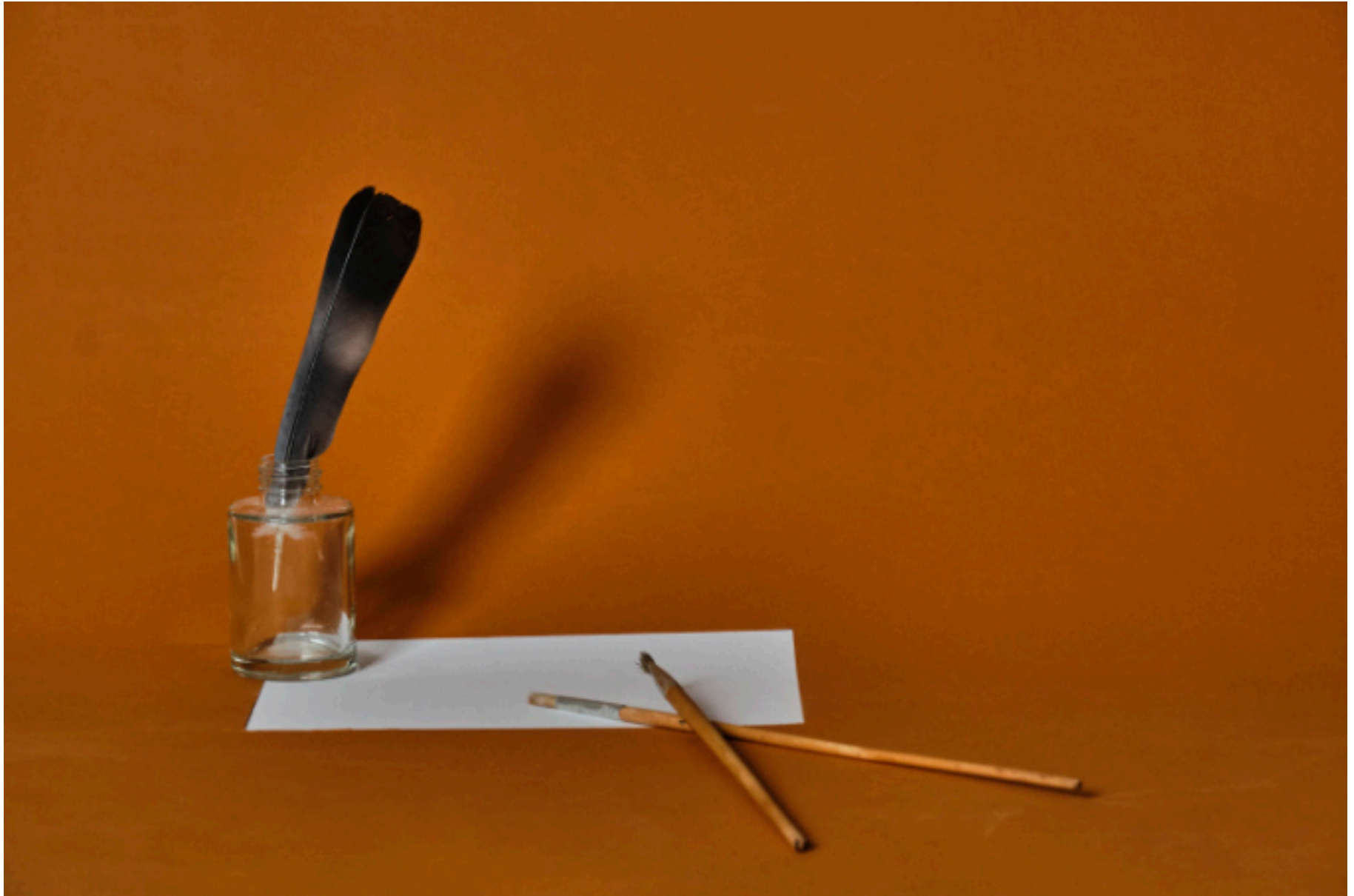
Feder mit Pinseln